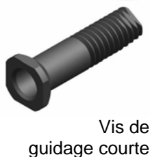
Vis de guidage courte