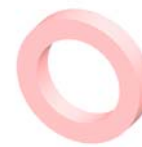
Anneau de maintien